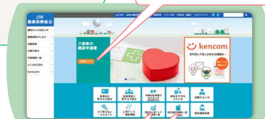
健保連人間ドック健診機関・集合契約健診機関の検索ができます

健診結果を確認して、所見がある場合には二次検査を受診してください。 また、健診結果から健康リスクを割り出し、特定保健指導の必要度を3段階で判定します。「積極的支援」や「動機づけ支援」の対象となった場合には、生活習慣の改善を図るための「特定保健指導」を受けることができます。